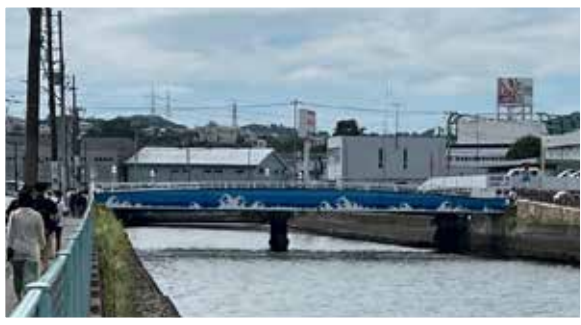
関東学院大学前にある雪見橋

左側には鷹取山の摩崖仏や鷹そして桜並木を、右側には関東学院大学の前にある雪見橋とオリーブの校章が描かれ、コラボ感も出ています。