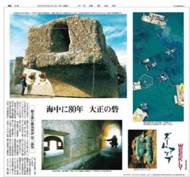
読売新聞夕刊2004年2月19日付

の良さから、ほとんどは再生コンクリートに再利用されたと聞いています。これらの遺構は「どんな立派な建物でも、地盤がしっかりしてなければ」という地震の教訓を伝えています。100年も経つと関東大震災と直接関わる物はほとんどありません。実際に目で見て、触れる貴重な遺構を、数多くの人に知ってもらいたいと思います。