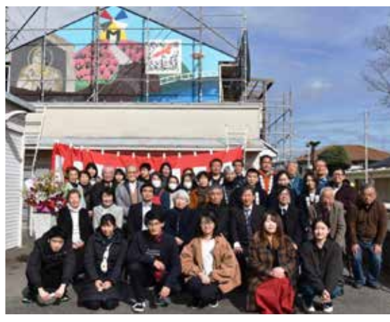
関係者の記念写真atお披露目式