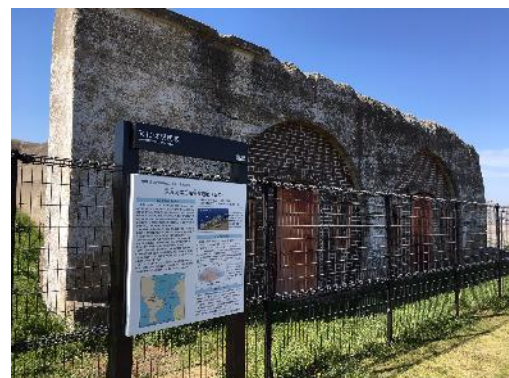
うみかぜ公園にある案内板