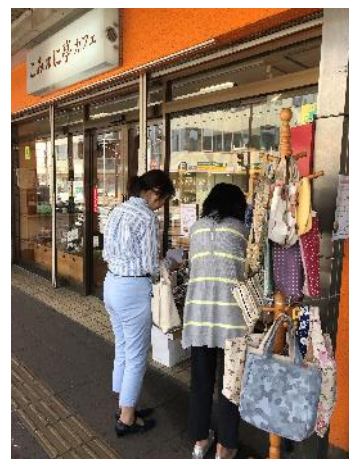
春のワゴンセール(2)