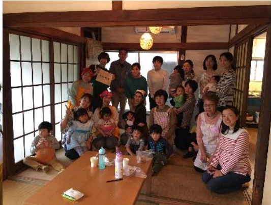
手作りおやつの会に集まった皆さん