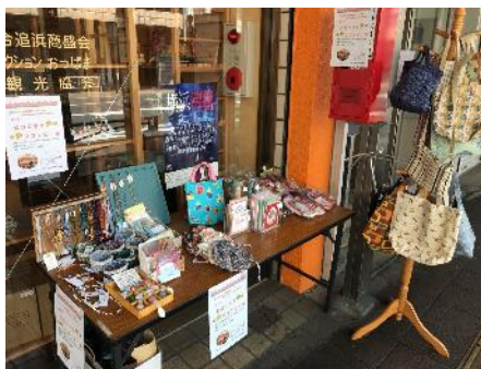
春のワゴンセール(1)

ワゴンセールの運営は、出店者の方々と決めていきます。開催日はこみゆに亭カフェの野菜の販売に合わせています。幸い多くの方が足を止め、売り上げを伸ばすことができました。