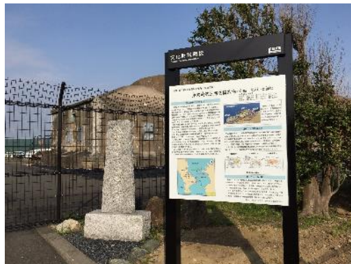
夏島都市緑地にある第三海堡の案内板

長年の懸案で、当法人がおっぱまはっけん倶楽部とともに設置を要請していた第三海堡展示場の文化財案内板が、横須賀市教育委員会により2019年3月27日に設置されました。なお、うみかぜ公園にある「兵舎」にも同様の案内板が設置されています。展示場を訪れる人はまずこの案内板に目を通すなど、効果は大きいと思います。